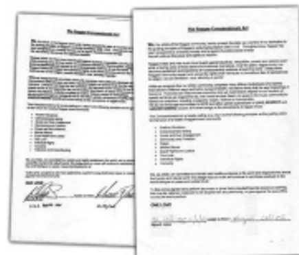
Le Reggae Compassionate Act

Nous souhaitons aussi rappeler que la loi prévoit que ceux qui appellent à l'une des discriminations prévues par les articles 225-2 et 432-7 du Code pénal à l'égard d'une personne ou d'un groupe de personnes à raison de leur orientation sexuelle sont punis d'un an d'emprisonnement et/ou de 45 000 euros d'amende (article 24 de la loi sur la presse de 1881).