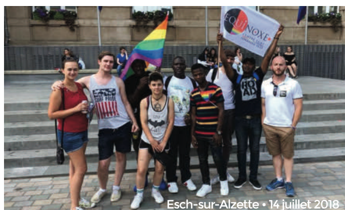
Esch-sur-Alzette • 14 juillet 2018