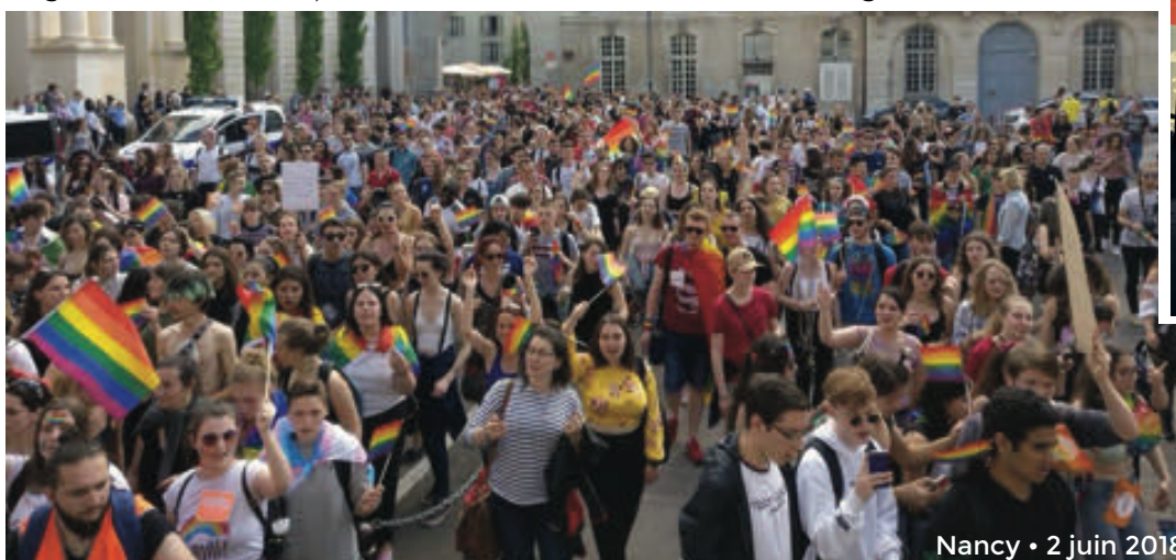
Nancy • 2 juin 2018

La manifestation finale du 2 juin 2018 , mise en place le jour J par une cinquantaine de bénévoles sur la Place de la Carrière, fut un très grand succès avec plus de 2000 personnes présentes sous le soleil et dans un cortège festif et militant. En outre, le déploiement d'une buvette au départ et à l'arrivée de la Marche nous a permis à la fois de fixer les participant-e-s dans un espace convivial (malgré les grosses exigences de sécurité) et de mieux financer l'événement, légèrement déficitaire