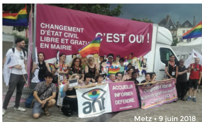
Metz • 9 juin 2018

Équinoxe et ses militant-e-s ont pris part, comme chaque année, d'une part au Metz Pride Day organisé par Couleurs Gaies et d'autre part au GayMat d'Esch-sur-Alzette organisé par Rosa Lëtzebuerg. Pour chacun de ces événements, où nous avons tenu un stand d'information, de visibilité et de vente de goodies, et où nous avons pris part au cortège, une grosse délégation d'Équinoxien-ne-s était présente (15 à Metz, 10 à Esch), parmi lesquel-le-s un nombre croissant de nos demandeur-se-s d'asile.