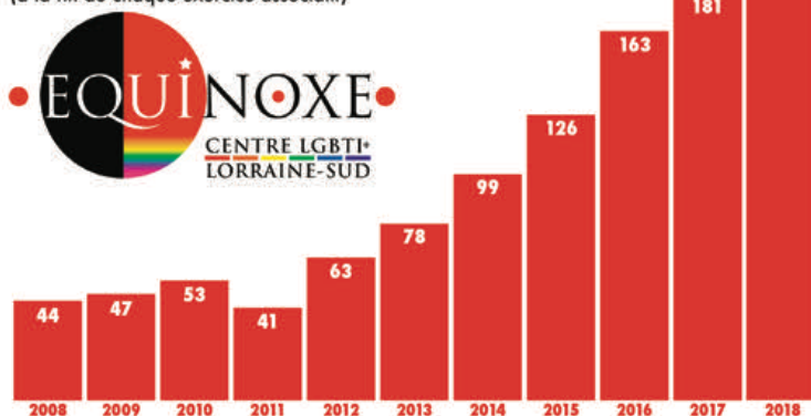
Évolution du nombre de membres d'Équinoxe Nancy (à la fin de chaque exercice associatif)

Équinoxe clôture 2018 à 194 membres (contre 181 en 2017 et 163 en 2016), ce qui en fait de très loin la principale organisation LGBTI+ sud-lorraine . Les membres sont dans une large majorité issu·e·s du Grand Nancy et de Meurthe-et-Moselle. On y trouve également quelques Mosellan·e·s et Vosgien·ne·s, ainsi que d'ancien·ne·s Nancéen·ne·s résidant actuellement à Paris ou à l'étranger.